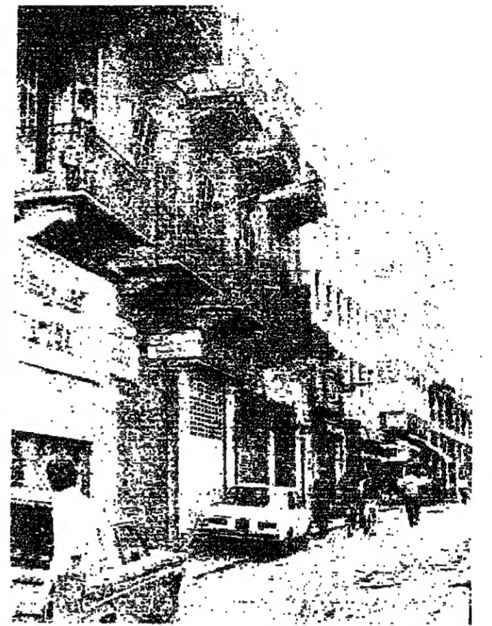
■ شارع الأمير بشر كما بدا امس

شهدت العاصمة امس تصنعا نسبيا في حالة الامن. دفع المواطنين إلى التناول بابكانية نجاح مباحسي التهيئة . الا ان هذا التناول كان حذرا إلى حد بعيد ، ذلك ان الذين اضطروا لمغادرة بيوتهم لتضاء بعض الاعمال ، كانوا يتنقلون في الشوارع بحذر شديد نخوفا من نشاط القنصاة الذي كان لا يزال مستمرا طول يوم امس . وعدد كبير من المواطنين اضطرتهم الحاجة إلى بعض المواد الغذائية والاستهلاكية للنزول إلى الأسواق على امل تامين حاجته ؛ الا ان الأسواق كانت مغلقة جميعها ، وكانت هناك نقط بعض العربات التي تتجول بكبيسات من الخضار والفاكهة . وقد لفت النظر امس ، قيام عمال التنظيفات بحملة ناشطة لجمع النفايات من الشوارع .